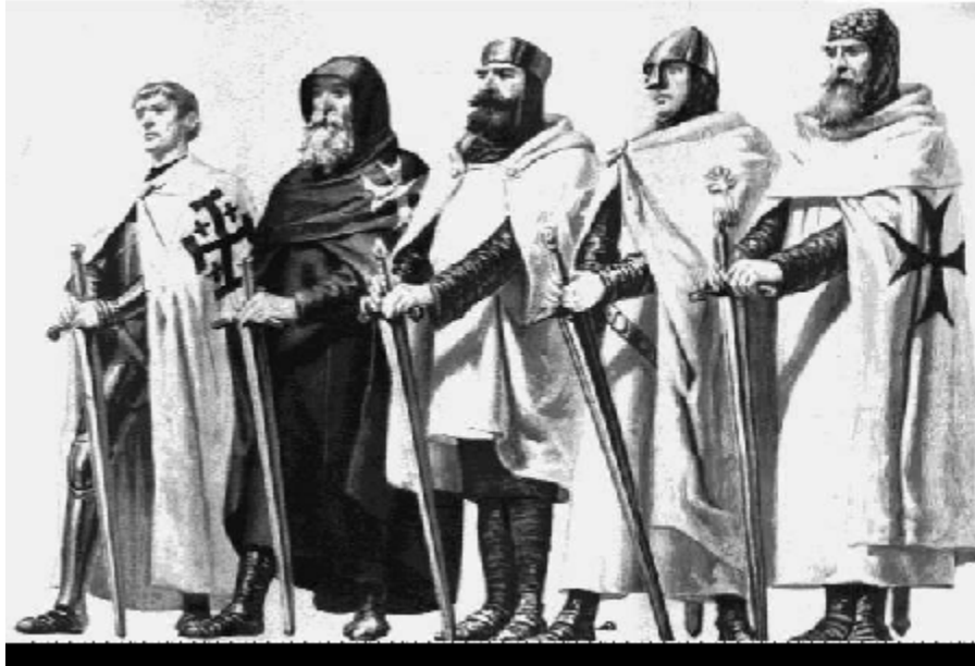
Différent ordres de Chevaliers